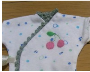
アップリケと刺繍